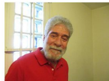
Georges Ibrahim ABDALLAH Communiste libanais, militant de la cause palestinienne. Emprisonné en France depuis 1984, il est le plus ancien prisonnier d'Europe, bien que libérable depuis 1999. (Lecture d'un texte qu'il nous a transmis)