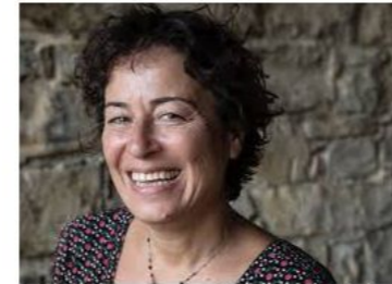
Pinar SELEK Acquittée à quatre reprises dans la même affaire, elle est la victime d'un acharnement sans précédent dans l'histoire judiciaire de la Turquie, dans le cadre d'un procès politique qui dure depuis un quart de siècle.